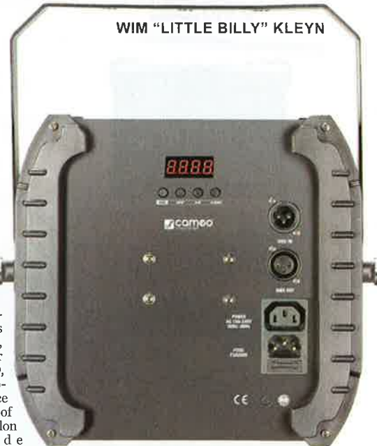
WIM "LITTLE BILLY" KLEYN

Comme promis il y a quelque temps, Cameo m'a fait parvenir quelques appareils à LED, six en tout, dont je vous propose les deux premiers ce mois-ci. Cameo, "Colours of light", était présent au salon de